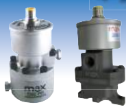
ウルトラ微小流量計